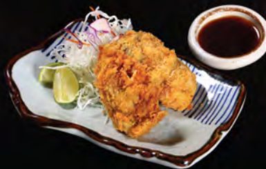
炸廣島生蠔 (2隻) 広島県産牡蠣フライ (二個) Deep Fried Hiroshima Oyster (2 pc)