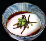
日式溫泉蛋 溫泉卵 Free Range Onsen Egg