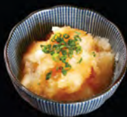
蔥花蘿蔔蓉汁 ネギ大根おろし Oroshi Sauce