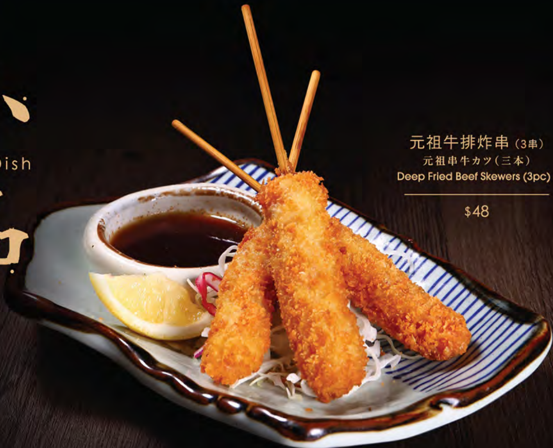
元祖牛排炸串 (3串) 元祖串牛カツ (三本) Deep Fried Beef Skewers (3pc)