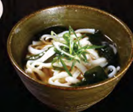
日式昆布湯烏冬 うどん Udon in Soup