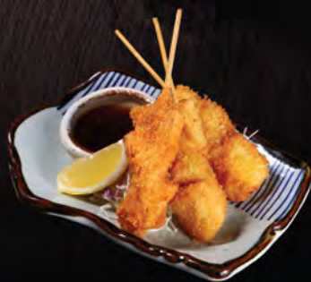
杏鮑菇炸串 (3串) 串カツ (三本) Deep Fried Mushroom Skewers (3pc)