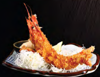
炸特選大海老 (1隻) 特選大海老フライ (一本) Deep Fried King Prawn (1pc)