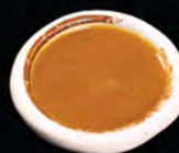
咖喱汁 カレーソース Curry Sauce