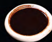
味噌汁 味噌ソース Miso Sauce